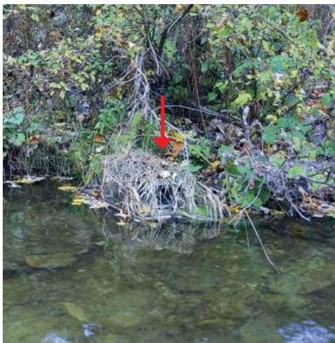
Obr. 4. Odchytný sklopec umístěný na monitorovacím raftu. (červená šipka)

Fig. 4. A live-trap placed on a floating raft (red arrow).