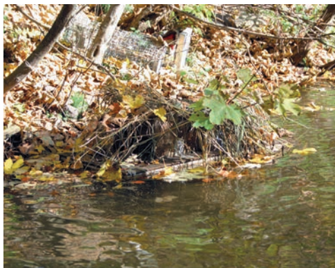
Obr. 1. Monitorovací raft pro zachycení přítomnosti norka amerického Neovison vison .

V rámci sledovaného období byly rafty kontrolovány v přibližně 14ti-denních intervalech. Při každé kontrole byly zdokumentovány všechny stopy přítomné na raftu a poté byla monitorovací plocha upravena (uhlazena). Pro srovnání relativních hustot norků s oblastmi, kde již tento průzkum byl proveden, byla spočítána návštěvnost norků na raftech: počet pozitivních záznamů norka na raftech dělený počtem „raftonocí“, které se vypočítají jako počet dní, kdy byly rafty exponované na tocích vynásobený počtem instalovaných raftů.