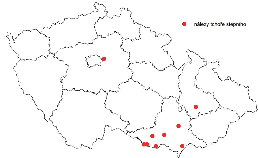
Obr. 2. Mapa recentních (2009–2014) nálezů tchoře stepního. Fig. 2. Distribution of recent (2009–2014) findings of the steppe polecat in the Czech Republic.

Sběr jedinců uhynulých na silnicích představuje v krajině, která je v současnosti velmi fragmentovaná, dobrý zdroj údajů o výskytu různých druhů živočichů. V rámci projektu byly během jednotlivých let opakovaně kontrolovány silnice všech tříd, a to hlavně na jižní